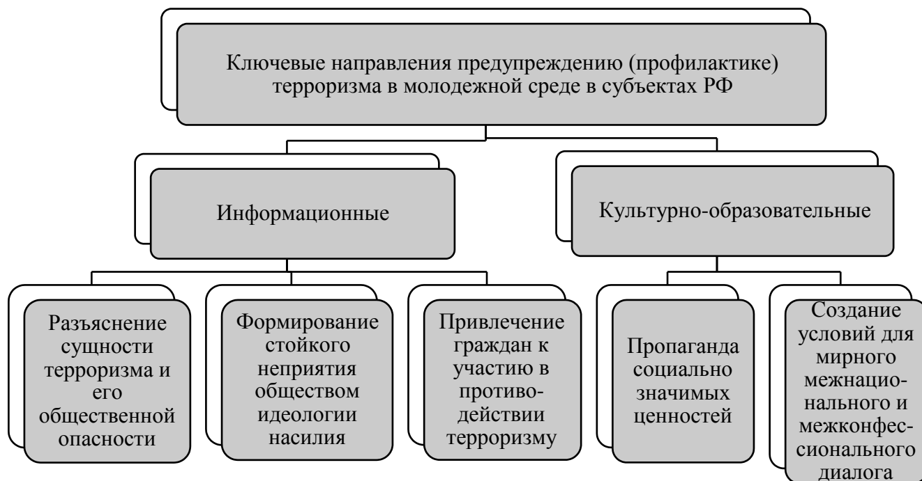
Рисунок 1. Ключевые направления предупреждению (профилактике) терроризма

Перечисленные выше направления реализации Комплексного плана предполагают следующие форматы проведения мероприятий: